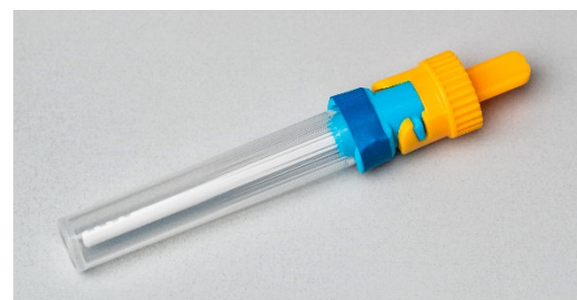
Abbildung 3: Verschlossenes Stuhlentnahmeröhrchen

Überschüssiger Stuhl wird an der Öffnung der blauen Hülse abgestreift, sodass nur eine definierte Menge ins Röhrchen gelangt. Ziehen Sie aus diesem Grund den Dosierstab nicht wieder heraus. Nutzen Sie das Röhrchen nur für eine Probenentnahme.