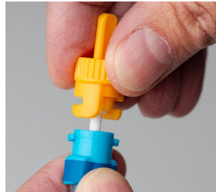
Abbildung 1: Herausziehen des Dosierstabes

Achtung: Halten Sie das Röhrchen nach dem Öffnen stets senkrecht, um ein Austreten der enthaltenen Flüssigkeit zu vermeiden. Nicht in die Augen, auf die Haut oder auf die Kleidung gelangen lassen!